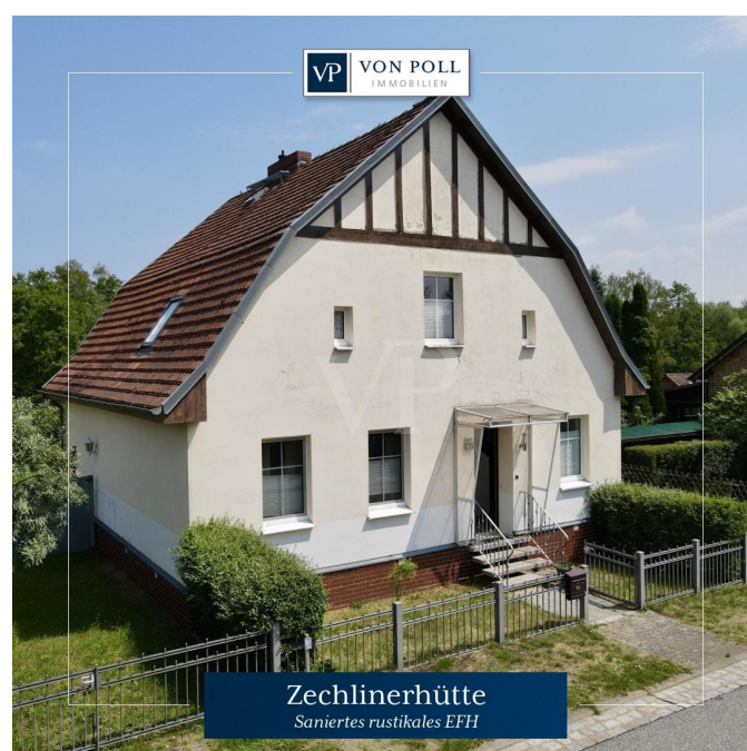
Zechlinerhütte Saniertes rustikales EFH