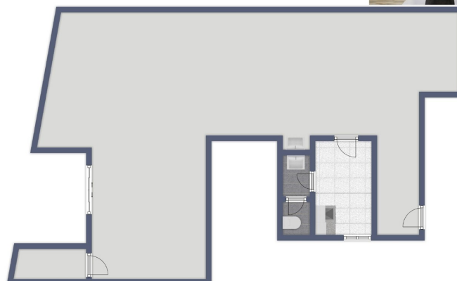
Grundriss nicht maßstabsgetreu

Dieser Grundriss ist nicht maßstabsgetreu. Die Unterlagen wurden uns vom Auftraggeber zur Verfügung gestellt. Aus diesem Grund können wir nicht für die Richtigkeit der Angaben garantieren.