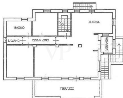
PIANO PRIMO H. = mt. 2,90