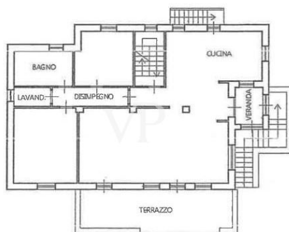
PIANO PRIMO H. = mt. 2,90