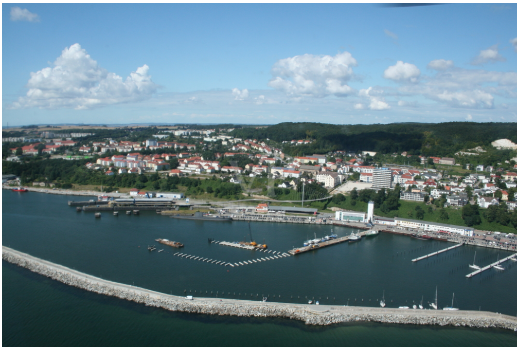
Neubau Apartment Hotel