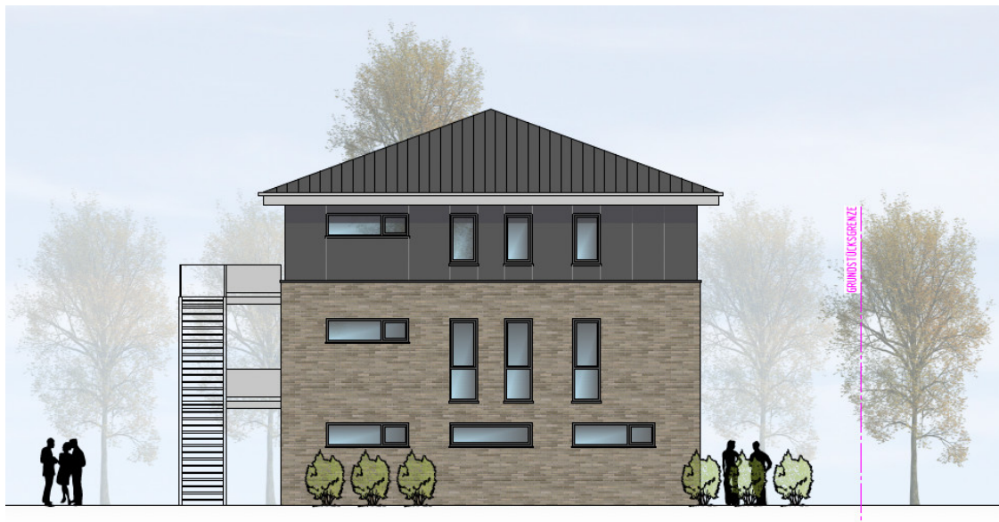
HAUS 3 ANSICHT VON NORDEN | M100