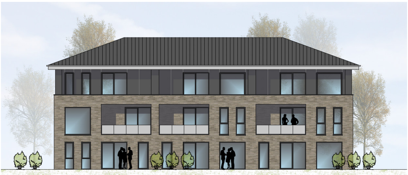
HAUS 3 ANSICHT VON WESTEN | M100