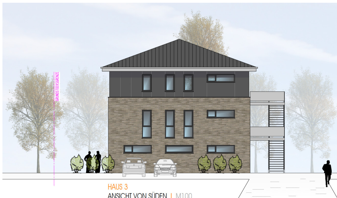
HAUS 3 ANSICHT VON SÜDEN | M100