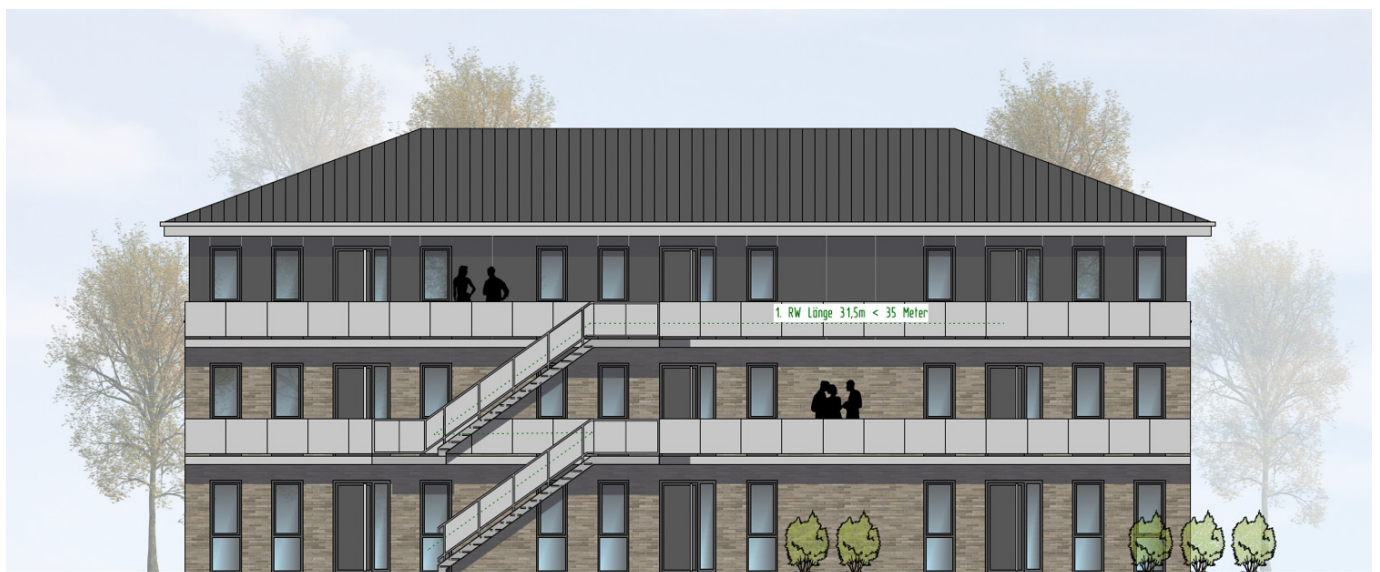
HAUS 3 ANSICHT VON OSTEN | M100