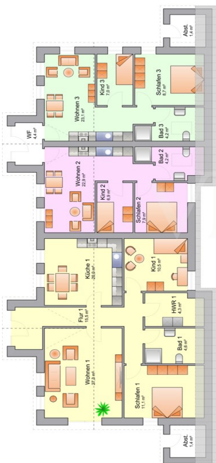
Grundriss EG Nebengebäude