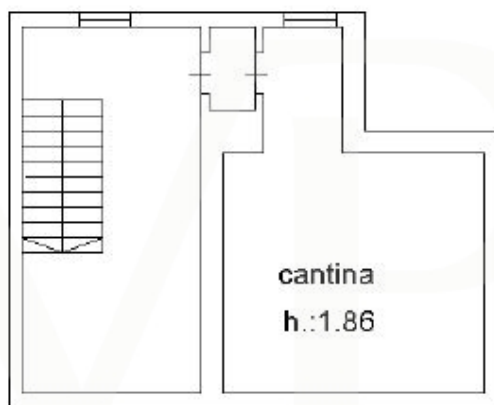
PIANO 1 SOTOSTRADA

Este plano no está a escala. Los documentos nos fueron entregados por el cliente. Por esta razón, no podemos garantizar la exactitud de la información.