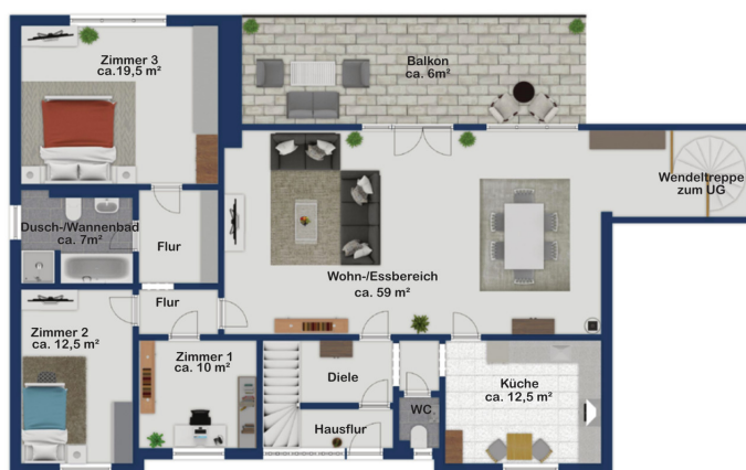
Exposé plan, nicht maßstäblich