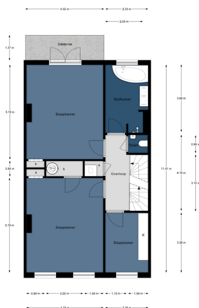
Alphenstraat 60, Den Haag | 2e Verdieping H = 2,36 m