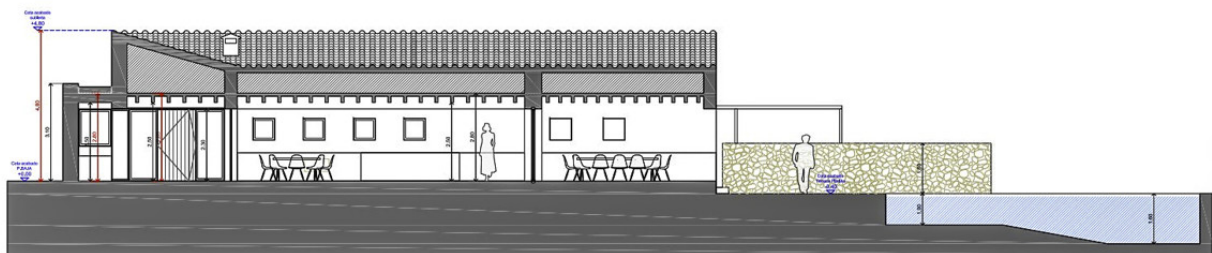
SECCIÓN 1 E: 1/50