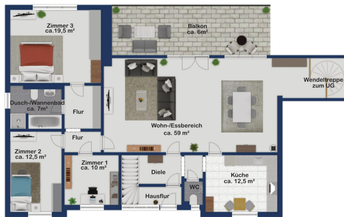
Exposé plan, nicht maßstäblich