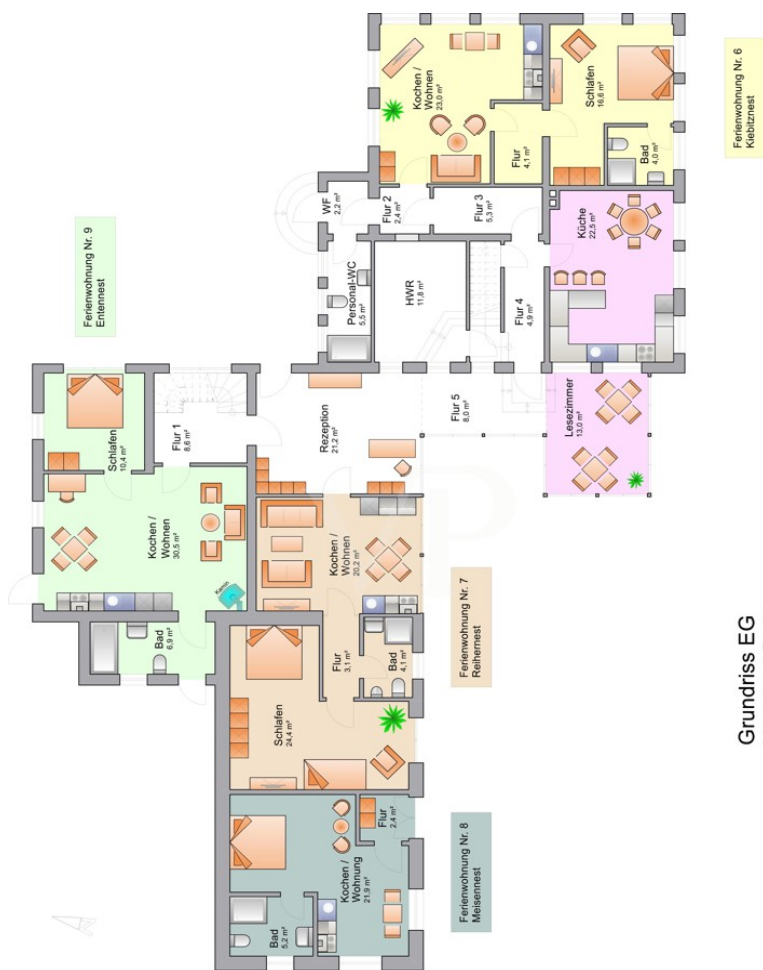
Grundriss EG Hauptgebäude