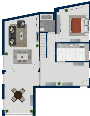
Exposplan, nicht maßstäblich