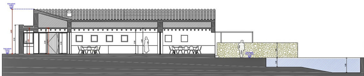
SECCIÓN 1 E: 1/50