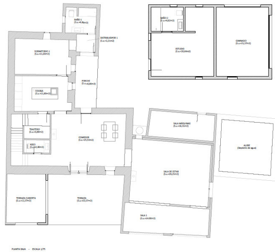
PLANTA SEGUNDA - ESCALA 1/25