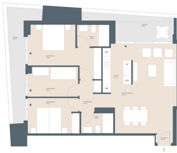
Bloque 4 Portal 7 P00-D