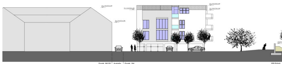
rd-West ≈ 20°/20°