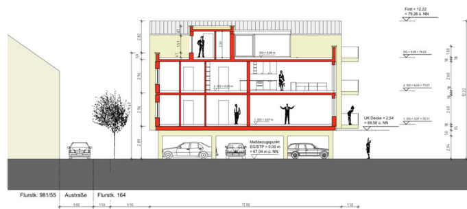
Schnitt 1-1 mit Flachdach im Bereich der Wohnungseingänge im DG