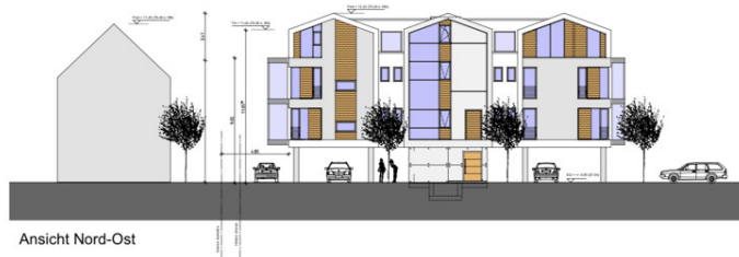
Ansicht Nord-Ost Variante 20°/20°