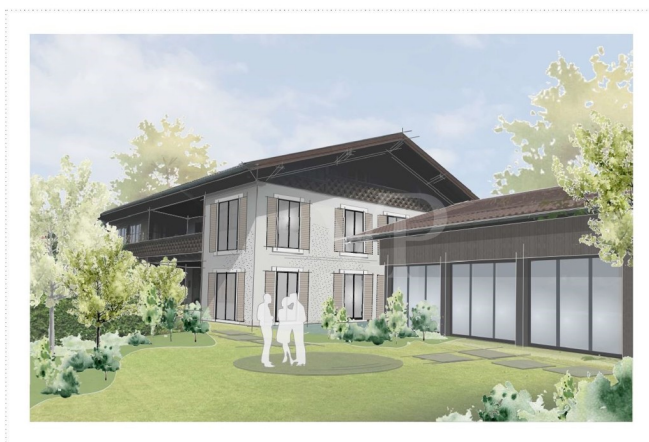
Perspektive - Fassadenstudie _V2