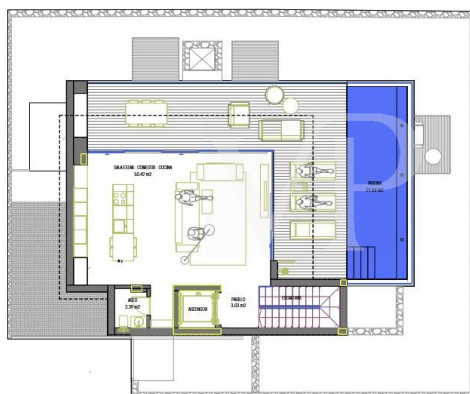
Parcela 31 Planta Alta