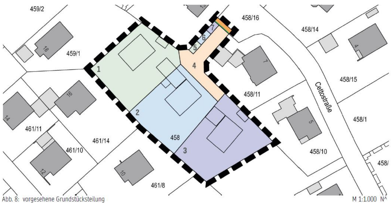
Abb. 8: vorgesehene Grundstücksteilung