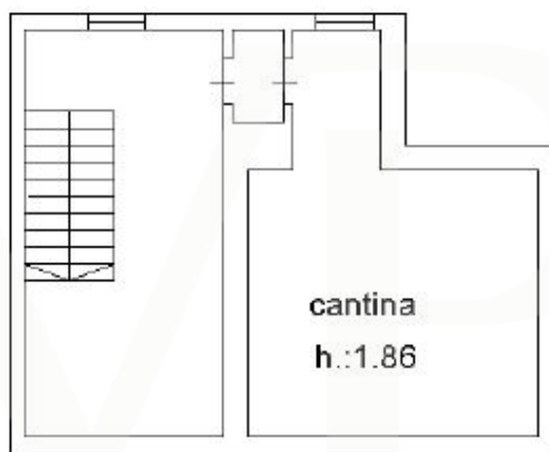
PIANO 1 SOTOSTRADA

Esta planta não é à escala. Os documentos foram-nos entregues pelo cliente. Por conseguinte, não podemos assumir qualquer responsabilidade pela exatidão das indicações.